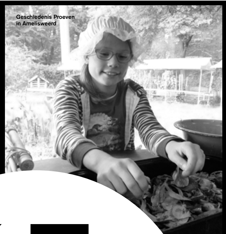
Geschiedenis Proeven in Amelisweerd