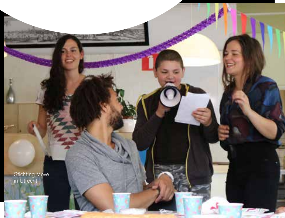
Stichting Move in Utrecht