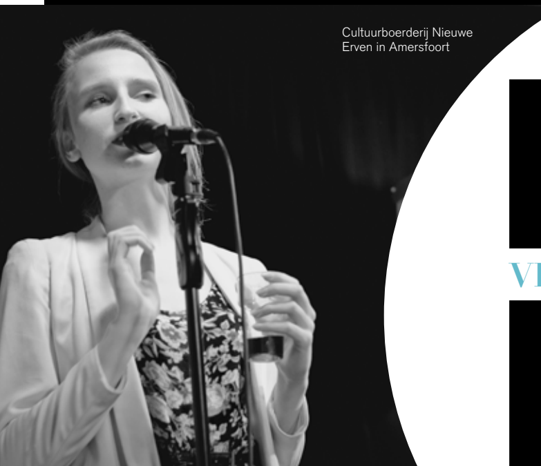
Cultuurboerderij Nieuwe Erven in Amersfoort