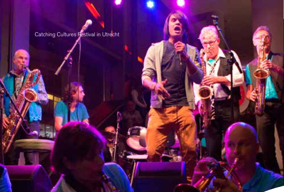
Catching Cultures Festival in Utrecht